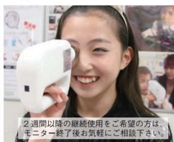
2週間以降の継続使用をご希望の方は、モニター終了後お気軽にご相談下さい。

中学生で5割以上、小学生でも3割の子供が近視になっている現代。ゲームや携帯、インターネットの影響で視力の低下が止まらない子供が激増しています。ここ「健改研」では、厚生労働省承認の医療機器「超音波治療器新型フタワソニック」を使った2週間無料モニターを募集します。