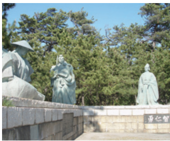
歌舞伎「勧進帳」で知られる安宅の関所。小松市で毎年開催されている「全国子供歌舞伎フェスティバル」。写真は勧進帳上演時のもの。