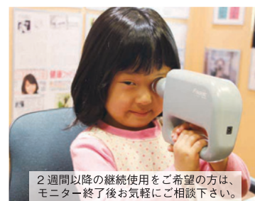
2週間以降の継続使用をご希望の方は、モニター終了後お気軽にご相談下さい。

「フタワソニック」。様子を見ているだけでは視力は悪くなるばかり、まずは無料モニターに参加して視力回復のチャンスをつかんでみてはいかがでしょうか?