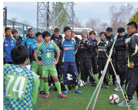
充実のトルコキャンプ

3月7日の開幕まで1ヵ月を切った。現在、チームはトルコでキャンプを行っている。イスタンブールから国内線に乗り継ぎアンタルヤという街へ。ヨーロッパの多くのクラブがキャンプ地として利用している。1月にはドイツ、2月はデンマークやハンガリーなど北欧の国がキャンプを張っている。2週間の間に、ヨーロッパのクラブとの練習試合も6試合ほど組まれているが、平均身長が15センチは上回るような体格の選手たちとぶつかり合っている。プレーは常に激しく、どんなサッカーをしていくのかも分からない。ただ、それこそ求めていた環境なのだ。練習も激しい。ある時、接触して倒れ、足を抑えて立ち上がれない選手にトレーナーが駆け寄り、監督はこう言った。「打撲だから大丈夫。自分で立て! 試合中は誰も助けてくれないぞ!」。選手は歯を食いしばって立ち上がりプレーを続けた。ケガの大小はぶつかり方を見ていれば絶対に分かる。監督は言う。確かに試合中は誰も助けてはくれない。一時の痛みであれば自分で乗り越えるしかないのだ。こういった働きかけにより、選手は倒れてもすぐに立ち上がるようになる。ひいてはなかなか倒れなくなるのだ。こうした毎日を送り、選手たちは逞しくなっていく。濃い日々を噛みしめるようにして過ごしている。