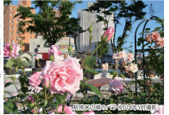
駅南口広場のバラ(2014年5月撮影)