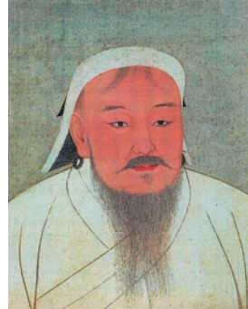
モンゴル帝国初代皇帝、チンギス・カンの肖像画(台湾・国立故宮博物院蔵)