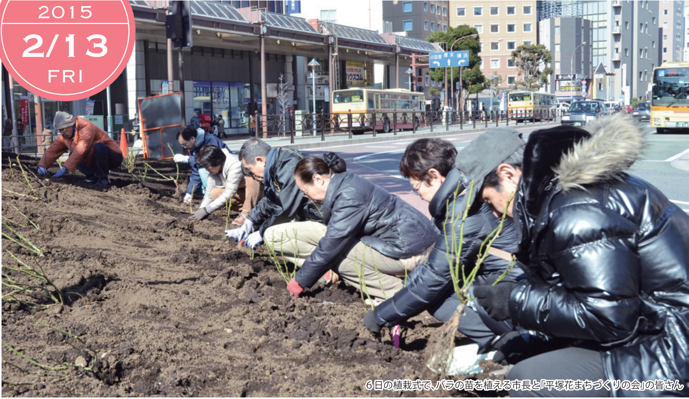
6日の植栽式で、バラの苗を植える市長と「平塚花まちづくりの会」の皆さん