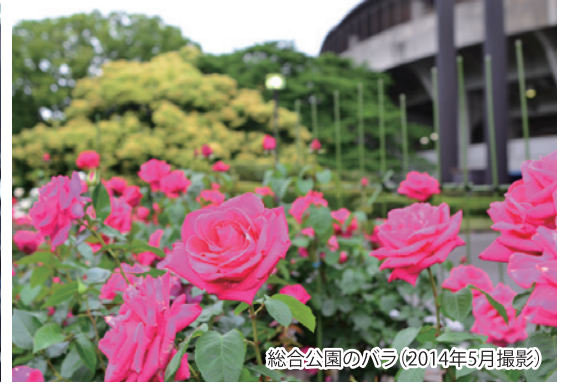
総合公園のバラ(2014年5月撮影)