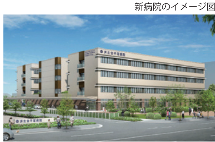
新病院のイメージ図

「築33年の経過による建物の老朽化」「施設が狭く、医療機器の導入に苦慮」「敷地が狭く、診療を継続しながらの現地建て替えが困難」「駐車場不足」といった理由などから、同院ではこの10年、移転新築を模索していたという。新たな病院では、これらを解消すると同時に「市域西側に偏在して