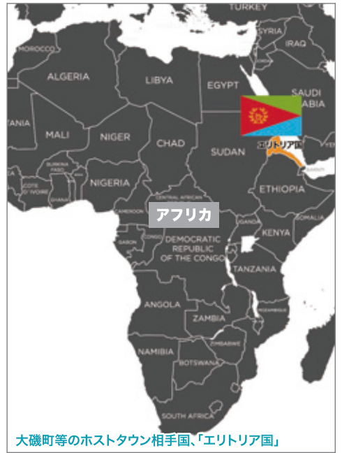
大磯町等のホストタウン相手国、「エリトリア国」