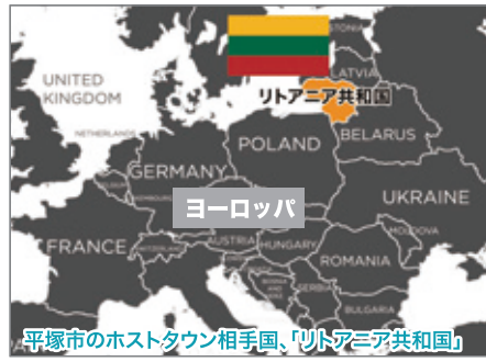
平塚市のホストタウン相手国、「リトアニア共和国」

また大磯町等のグループは、アフリカ北東部のエリトリア国を相手国として登録された。既に去年9月同国と事前キャンプ地として協定を締結。大会で来日する同国選手を地域イベントに招待したり、特産品を活用して地域の魅力を発信するなど、交流を深めていくこととしている。