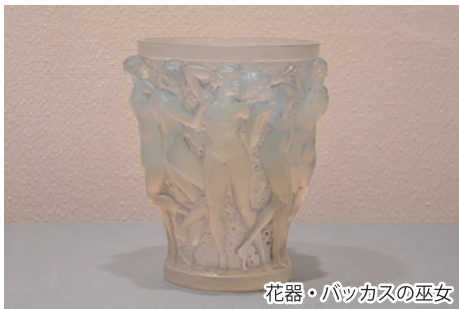
花器・バッカスの巫女