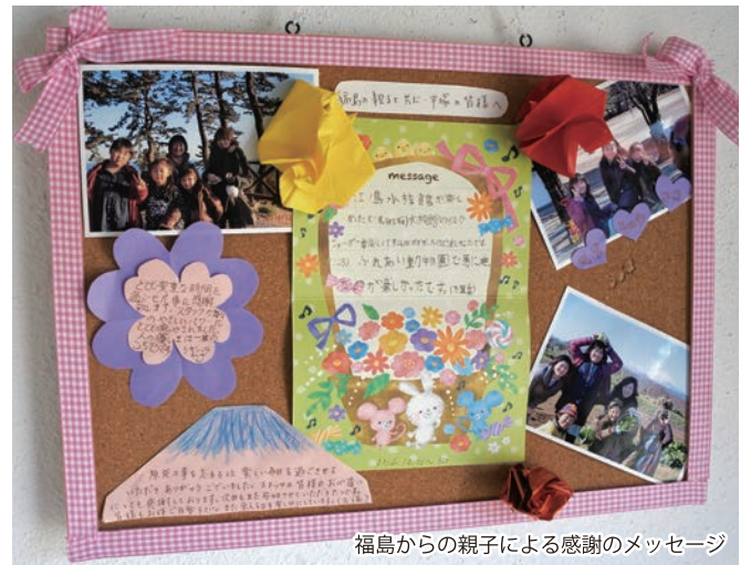
福島からの親子による感謝のメッセージ