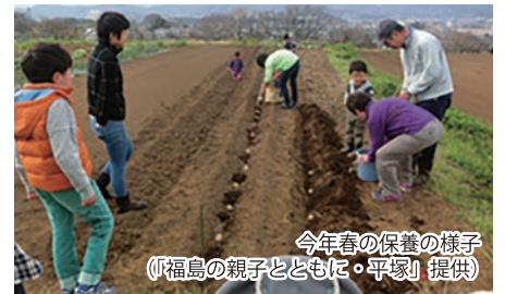
今年春の保養の様子