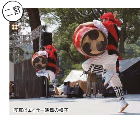
写真はエイサー演舞の様子

大磯プリンスホテルではゴールデンウィークの3日間限定で地曳網体験を開催！眼下に広がる水平線を目の前にみんなで協力して網を曳いて魚を獲ろう！予約不要でお気軽にご参加いただけます。会場に駐車場はございませんので、お車でお越しの方は、大磯プリンスホテル駐車場へお願いいたします。大磯プリンスホテルより無料のバスを運行しております。駐輪場は会場にございます。詳しくはWEBページをご覧ください。何が釣れるかは網を引いてみてのお楽しみ！