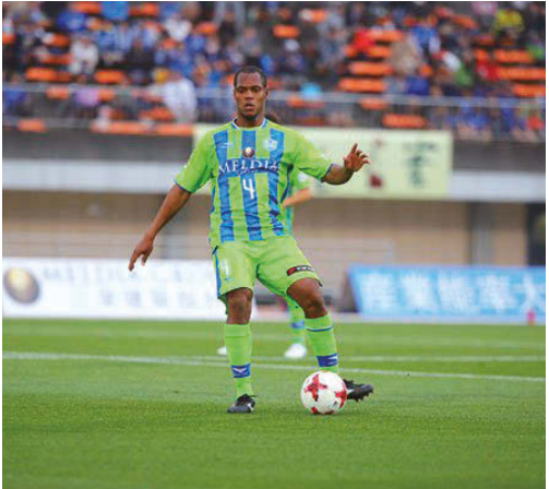
この日はチームの屋台骨であったアンドレバイアがまさかの警告2回による退場となった。 TEXT: 名久井啓祐(本紙編集部)