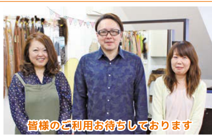
皆様のご利用お待ちしております

ヘアコンプレクシオンは、幅広い年代の方が利用する人気のヘアサロン。市内でも数少ない無料送迎の美容サービスも行うお店だ。「送迎美容」とは、希望されるお客さまの自宅までお迎えに上がり、店舗での施術後、自宅まで送り届けてくれるサービス。送迎代は掛からず施術料金のみで利用できる。外出はできるが、交通の便も悪く体力的にも出るのが難しい方、特にシニア世代の利用者が増えている。施術を担当する店舗スタッフは、全員20年以上のキャリアをもつベテラン美容師達。アットホームな雰囲気の中、あなたにピッタリのスタイル提案を行ってくれる。送迎美容は付き添いも可能。詳しくはお店まで気軽にお問合せを。