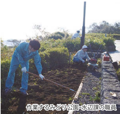
作業するみどり公園・水辺課の職員