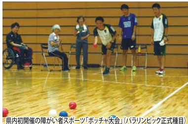
県内初開催の障がい者スポーツ「ホッチャ大会」(パラリンピック正式種目)

知事からは、全国各地では、広域のエリアで自転車を利用できる仕組みとして、複数の駐輪場に自転車を配備し、アプリを使って借りられる、いわゆる「自転車シェアリング事業」が広がっている。まず国道134号沿線の市町や地元観光協会などに呼びかけ、(仮称)「湘南地域/自転車観光/推進協議会」といった体制を作り、事業の実現可能性や具体的な実施方法などについて検討すると答弁。