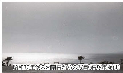
昭和30年代の湘南平からの写真