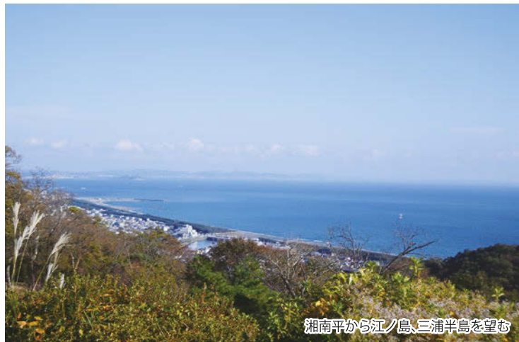
湘南平から江ノ島、三浦半島を望む