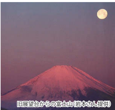
旧展望台からの富士山