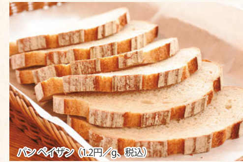
パンペイザン (1.2円/g、税込)