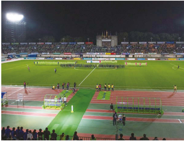
試合後にはセレモニーも行われた TEXT: 名久井啓祐(本紙編集部)

の悲願ではないかと思う。クラブとしても徐々に力を蓄え、今年はホームタウンの拡大もした。来年には前身である藤和不動産サッカー部の創立から50周年というアニバーサリーイヤーを迎える。来年はどんな1年になるか。それを想像してアレコレ話すのも楽しいが、節目にふさわしい何か素晴らしいことが起こってくればと1人のファンとして願わずにはられない。