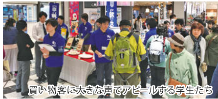
買い物客に大きな声でアピールする学生たち

期間中も、学生たちが売り場に立って買い物客に商品をアピールしていた。また、初日で売り切れになってしまい、急遽追加製造するほど好評な商品もあり、予想を超える売上に。バレンタインデーでの販売を