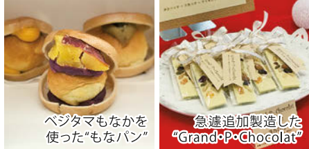
ベジタマもなかを使った「もなパン」