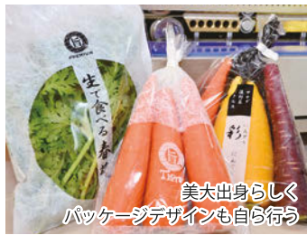
美大出身らしくパッケージデザインも自ら行う