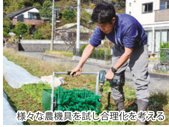
様々な農機具を試し合理化を考える