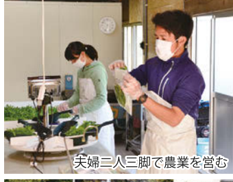
夫婦二人三脚で農業を営む