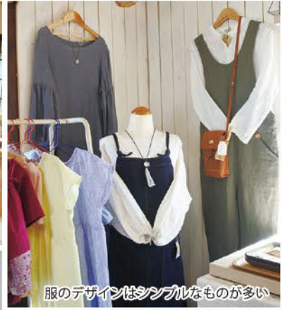
服のデザインはシンプルなものが多い