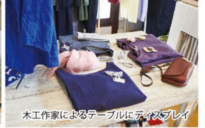
木作家によるテーブルにディスプレイ