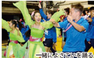
和太鼓の演奏に挑戦