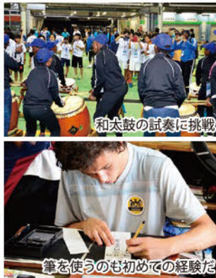
筆を使うのも初めての経験だ