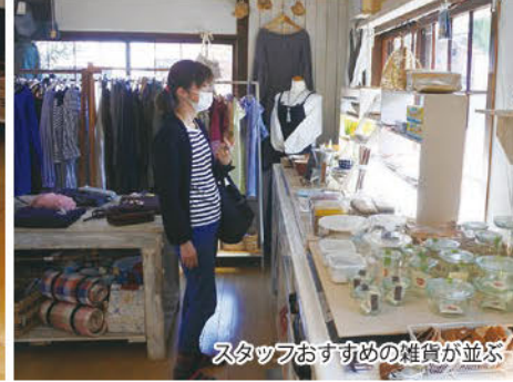
スタッフおすすめの雑貨が並ぶ