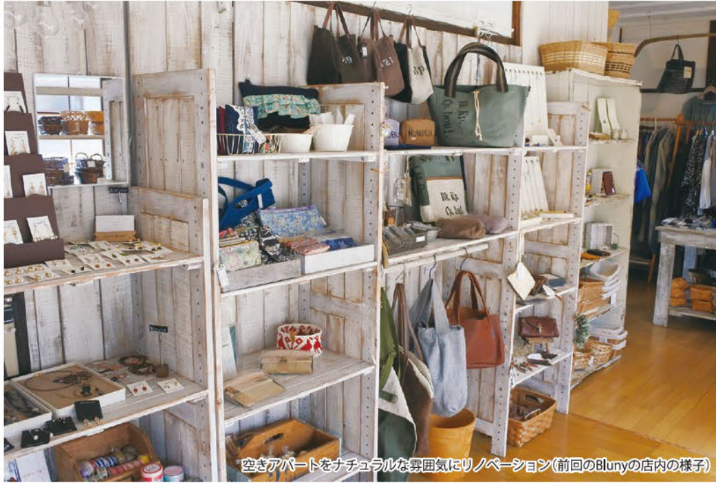
空きアパートをナチュラルな雰囲気のリノベーション(前回のBlunyの店内の様子)