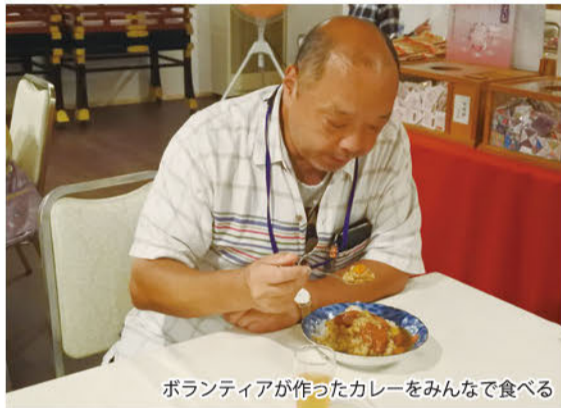
ボランティアが作ったカレーをみんなで食べる