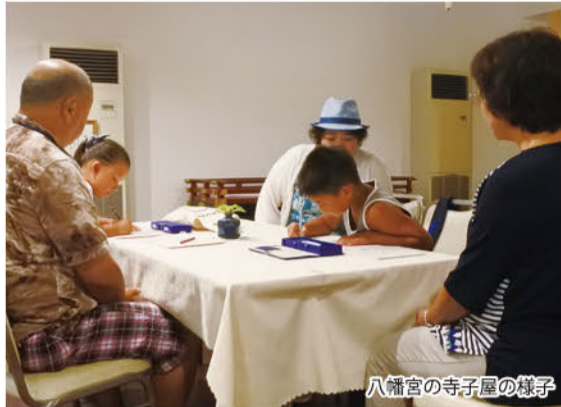
八幡宮の寺子屋の様子