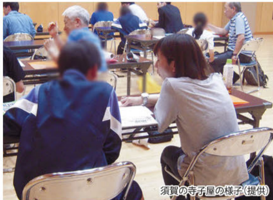
須賀の寺子屋の様子