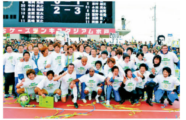
2009年最終節、水戸を逆転勝利で下し11年ぶりの昇格を手にした

2009年12月5日、この日に見た光景は今でも鮮明に覚えています。11年ぶりとなるJ1昇格を果たし、かつて味わったことのないほど大きな喜びがベルマーレに訪れました。