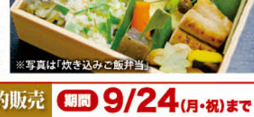
※写真は「炊き込みご飯弁当」