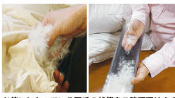
お使いになっている羽毛の状態をご確認頂けます。かしわぎの羽毛ふとんリフォームは専用の羽毛洗浄機で一枚ずつ丁寧に個別洗浄致します。

使い始めから7~10年がリフォームの目安となる羽毛布団。年数が経つごとにボリュームがなくなった、汚れ、臭いが気になってきたなど、たとえ外観が綺麗でも羽毛は傷み、汚れているものが殆どだそう。同店のカウンセリングは、お客様の目の前で羽毛を取り出し傷み具合を診断。リフォームで羽毛の再生が可能かアドバイスしてくれる。なお、リフォーム費用は足し羽毛の質や量、生地など補修の度合いによって変動するので、まずは気軽に無料診断を。