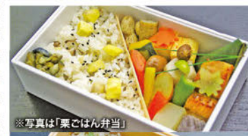
※写真は「栗ご飯弁当」

日本料理店ならではの出汁の風味を生かした塩分控えめの薄味と油を使わない調理が、シニアや女性にも優しいお弁当だ。敬老弁当の種類は3種類。5,000円以上の注文、または配達料300円で自宅まで配達も可。同店自慢の出汁の旨みたっぷり！松茸入り茶碗蒸しもお勧めだ。