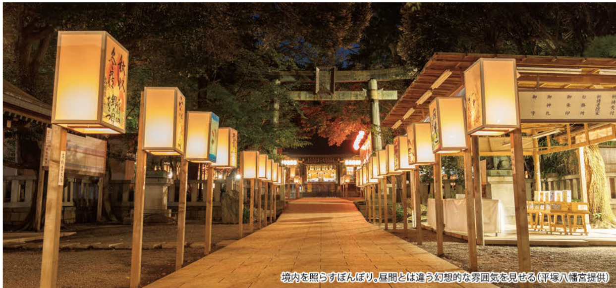
境内を照らすぼんぼり。昼間とは違う幻想的な雰囲気を見せる