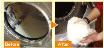
見た目だけではなく中身のリフォームも重要な羽毛布団。ぜひ一度、羽毛診断士にご相談を。