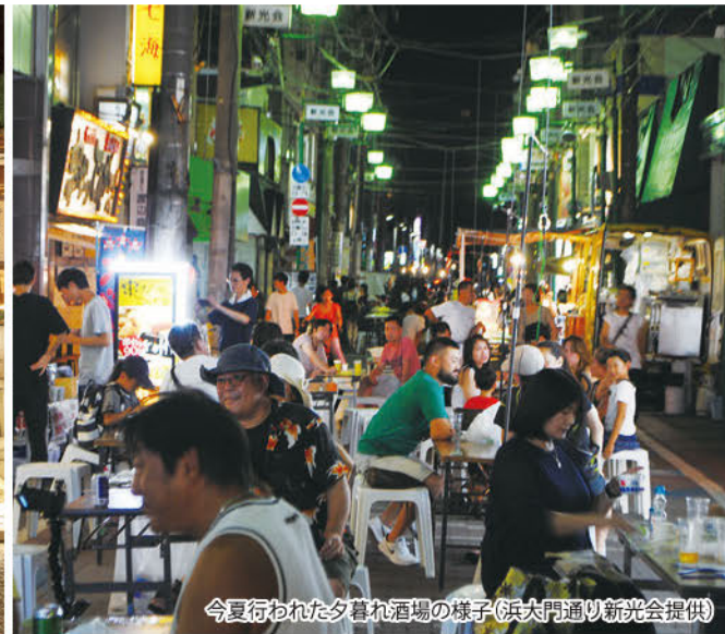
今夏行われた夕暮れ酒場の様子