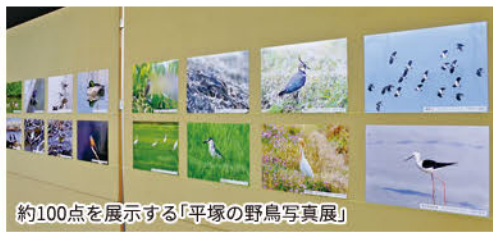
約100点を展示する「平塚の野鳥写真展」

補修工事のため休館していた平塚市博物館が、2月1日から全面的に開館する。同館では昨年8月、職員用階段の天井から化粧モルタルが落下。点検の結果、補修が必要と判明し10月から工事を行っていた。