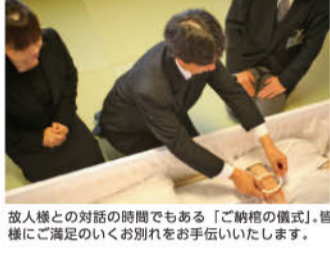
故人様との対話の時間でもある「ご納棺の儀式」。皆様にご満足いくお別れをお手伝いいたします。

多くの方のご納棺の儀式をお手伝いし、「しっかりとお別れができてよかった」と多くのお客様からご満足のお声をいただいております。ご家族の想いをくみ取りながら納棺のできるご葬儀をお手伝いできるような努めております。