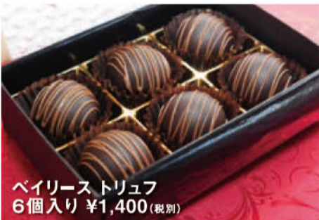
ベリース トリュフ 6個入り ¥1,400(税別)