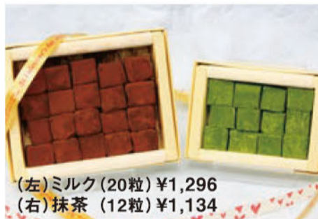
(左)ミルク(20粒) ¥1,296 (右)抹茶(12粒) ¥1,134

コンディトライ バッハマン ☎ 0463-23-5210 〒 平塚市八重咲町24-28 🕒 9:00 ~ 20:30 📅 月1回火曜 バッハマン 平塚 検索