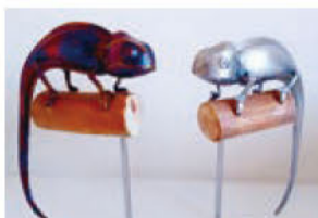
工房ARTSURU (ステンレス工芸) カメレオンのオブジェ