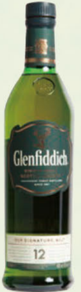
グレンフィディック (店内オーダーにより一杯 ¥1,100)

「お客様のリラックス空間をつくりたい」と語り出してくれたのはバーテンダー歴33年の糠信さん。長年の経験を踏まえた、チョコレートに合う一杯をセレクトしてくれた。誰でもすぐに試せる洋酒としてオススメなのはシングルモルトウイスキーだという。モルトウイスキーは麦芽の風味が特徴的で、カカオの味わいと共に引き立て合うのだ。お供に選びたいのは少し甘みがあるミルクチョコレート。今年のバレンタインは、空間、時間ごと楽しめるバーを訪れてみては？ お店でもチョコレートのオーダー可能。