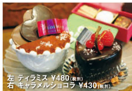
左 ティラミス ¥480(税別) 右 キャラメルショコラ ¥430(税別)

アトリエ アンジェ Atelier Ange 0463-26-5790 平塚市見附町42-15 102号 9:00~20:00 木曜 アトリエアンジェ 検索