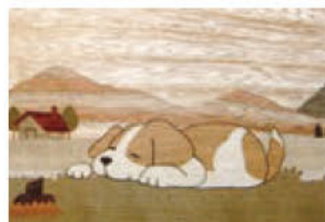
高橋 貞雄 (木象嵌工房 貞) のんびり~