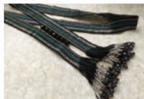
田島 真里 (銀猫舎) ビーズステッチのネックレス