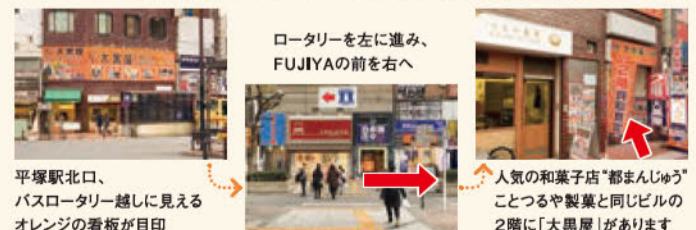
平塚駅北口、バスロータリー越しに見えるオレンジの看板が目印