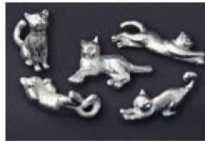
アトリエY (錫工芸) ネコの箸置き