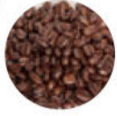
ブレンド ショコラータ ¥1,728 (200g)