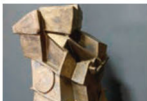
金谷 研介 (陶芸) 龍跡(オブジェ)