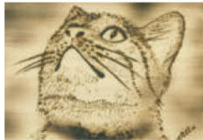
Art&Craft 夢家族 (パーニング) はなちゃん:虫が居る

会場: 東横イン元麻布ギャラリー平塚 (平塚市明石町1-1 東横イン平塚駅北口1/1F)