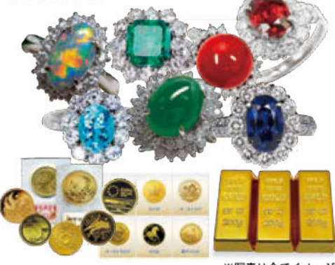
※写真は全てイメージ