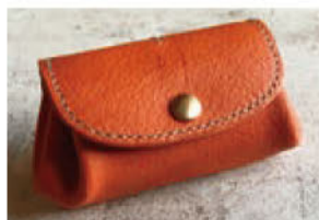
しっぽ企画 (伊豆高原レザー) 猪革のコロコロ財布