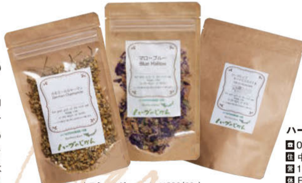
カモミールジャーマン ¥890(20g) マローブルー ¥1,170(10g) ローズヒップハイビスカス ¥1,800(20個入り)

この3種の調合を提案してくれたのは「ハーブのじかん」の横山店長。「胃腸を整える作用があるといわれるカモミールとマローブルーがカカオの刺激を和らげ、美肌効果のあるローズヒップハイビスカスで気になる脂質もカバーできる一杯」と、体ケアの視点がうれしい。気になる味わいはローズヒップの酸味がさわやかな印象で、甘みの強いミルクチョコレートに特に合いそうだ。チョコレートと相性のいいシナモンを加えて、香り高く仕上げるのも本格的。