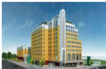
2020年6月(予定) 詳しくはお問い合わせください 茅ヶ崎駅より徒歩5分に新設の介護付き 有料老人ホームがリニューアルオープン!

2020年にリニューアルオープンする“湘南ふれあいの園”が、参加無料の知って得する老人ホームの「お役立ち講座」を開催、現在参加者を募集中だ。