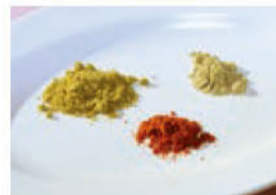
左からコリアンダー、パブリカ、カルダモン