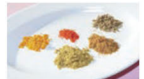
左からターメリック、コリアンダー、パブリカ、クミン、クミンシード