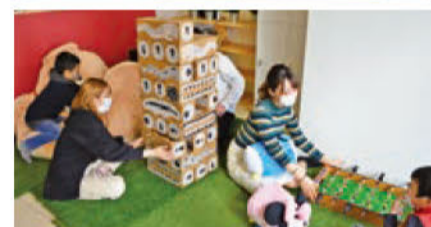
[写真上] 机に埋められた駅周辺のマップ [写真下] 一時預りの様子