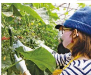
収穫には「キュウリ爪」なる道具を使う 「おー! 簡単!」