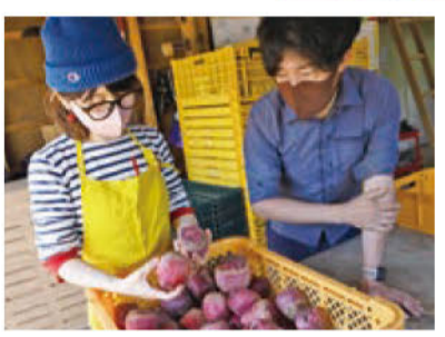
「選ぶコツは？」 「色が濃い方が栄養価が高いですよ!」