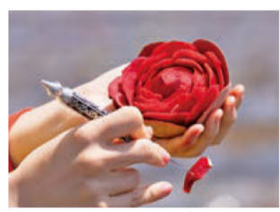
半分のピーズからみるみるバラを彫り出す 切れ端はまるで花びら