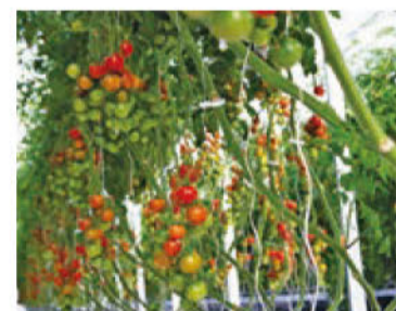
ドウのような鈴生りのトマト 土壌にはヤシ殻を使用