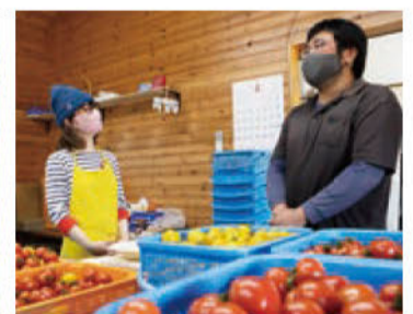
直売所には山積みトマトが ジュースなどの加工品も