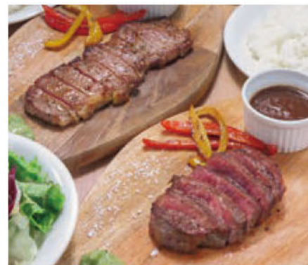
平日限定やわらかサーロインステーキ150g 税込1,320円(左)、やわらかヒレステーキ120g 税込1,320円(右)

平日のランチを始めるにあたって、定休日や営業時間に変更があるので事前にチェックの上、早めの予約をおすすめしたい。