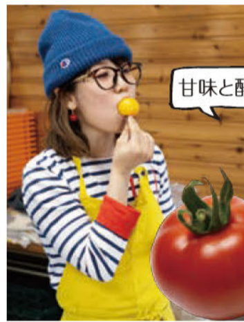
「甘い!実がしっかりしてますね!」

目指すトマトはあの日の『桃太郎』。「エキス分の多い、うま味風味がドカッとくるトマトですかね。高いレベルでバランスの取れた、自分がおいしいと思えるものを作りたいです」