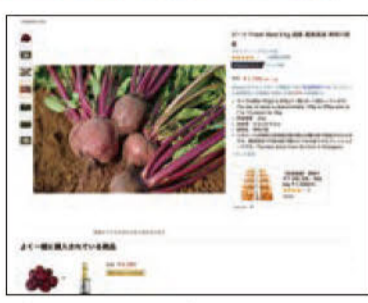
ピーズはAmazonで販売するほか 「あさつゆ広場」のような直売所でも販売