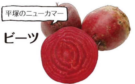
平塚のニューカマー