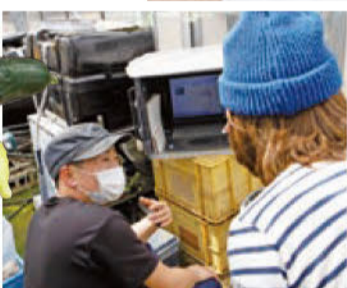
PCで栽培の様子をモニタリング 試行錯誤の日々だ