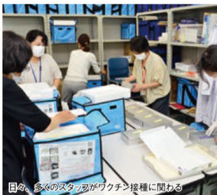
日々、多くのスタッフがワクチン接種に関わる