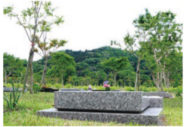
写真上：湘南森林霊園のテラスから望む渋沢の森。ここに座って森を眺めると気持ちがいい。写真下：墓所からの眺望。緑まぶしい芝生が敷き詰められた霊園には桜やけやき、もみじなどが植林され森との融合は始まっている。