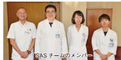
SASチームのメンバー

障害のリスクは4倍に高まります。SASの関与によって、糖尿病や高血圧、高脂血症といった生活習慣病の薬がうまく効かないということも起こります。実際、SASの治療を始めて、高血圧が改善した患者さんが多くいらっしゃいます。こういったケースから、SASという病気を広く知ってもらいたいことが大切かを、痛感しています。