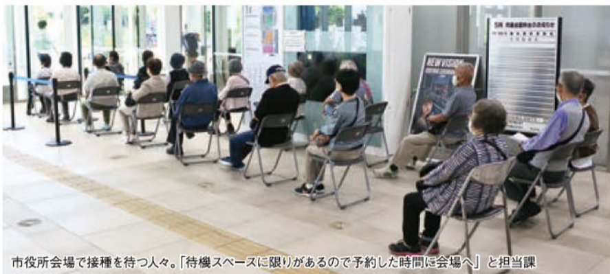
市役所会場で接種を待つ人々。「待機スペースに限りがあるので予約した時間に会場へ」と担当課

75歳以上の高齢者への接種も目処が付き、65歳から74歳への接種券の送付が始まった。 ワクチン接種では集団接種に限らず、新たに始まった医療機関での個別接種も選択肢に加えたい。