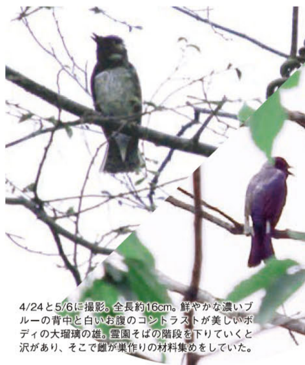
4/24と5/6に撮影。全長約16cm。鮮やかな濃いブルーの背中と白いお腹のコントラストが美しいボディアの大瑠璃の雄。霊園そばの階段を下りていくと沢があり、そこで雌が集作りの材料集めをしていた。

人は生まれる場所を選べない。しかし、永遠の眠りにつく場所は決められる。 秦野渋沢丘陵の豊かな森に囲まれ、聞こえるのは樹木のささやきと鳥たちの歌声のみ。 初夏には、日本三鳴鳥のひとつ「大瑠璃」の美しいさえずりが響く。