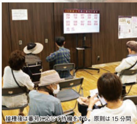
接種後は番号に応じて待機をする。原則は15分間