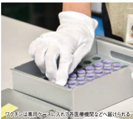
ワクチンは専用ケースに入れて各医療機関などへ届けられる