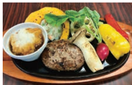
おろしポン酢でさっぱりおいしい、米沢牛100%ハンバーグ