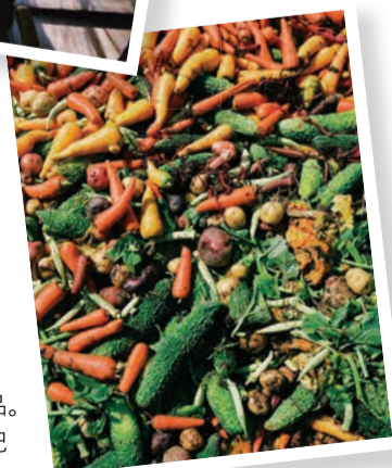
農業を撮影した作品。大自然との戦いの記録だ。

もそういうタイプなので、ベストな選択をしているとは思いません。行く先は見えない、でもそれそのものが楽しみなんだと思います」