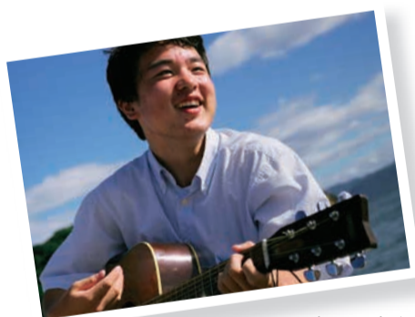
過去に日本を旅した時の作品。今回も多くの人との出会いがある。

じつは、2009年、2010年の2回、徒歩での日本縦断を経験している。「樹木を植えながら各地を回る環境活動プロジェクトに参加しました。バックパックを背負って歩くことはとてもしんどりきたんですが、環境活動のほうにのめり込めなくて旅しながら写真を撮る活動からは少し離れた。だが、先のコンペの話が舞い込んできた。「日本を歩く時が来た」と、直感的に思いました」