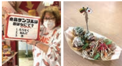
Tommyさんのクイズ、5問中2問を間違えました……