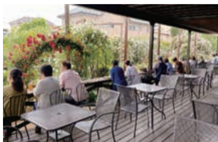
バラを目の前に食事ができるローズカウンター

自然に囲まれ、きれいな空気と広々とした敷地が自慢の厚木市山際「レストラン&ローズガーデン栗の里」。20mのローズテラスカウンターで、咲き誇るバラを眺めながら優雅に食事ができる。店長が米沢市の観光大使を務めていることもあり、米沢市場との強い関係性で仕入れられる米沢牛をぜいたくに使った米沢牛100%ハンバーグ おろしポン酢野菜添えがライス付きで1,980円とお得に食べられる絶好のチャンス! 今週末は栗の里へ行こう!