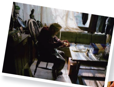
弁当配達をした時の作品。独居高齢者の生活のリアルが写し出される。

「はい、家族にかかる負担もある。『今回は支えてもらっています』逆のパターンもあり得ます。このスタイルに行き着いたというのがあります。腰を据えて仕事をし賃金を得るといのは、残念ながら僕にとっての『生きる』ではなかった。妻