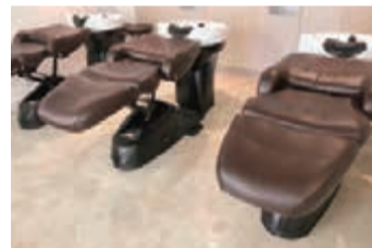
首に負担がかからないフラットシャンプー台でリラックスしてシャンプーやヘッドスパが受けられ、ゆったりと過ごせる

「WEEKENDを見た!」でご予約の方 全メニュー 通常料金より 初回限定 15%OFF! ※有効期限:2023年4月30日まで