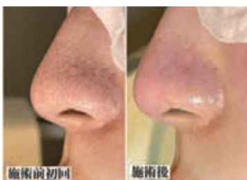
効果がはっきり分かる「毛穴エクストラクション」で、想像以上のツルツルを実感して!

「WEEKENDを見た!」でご予約の方 低周波シメケア専任記念価格 通常26,400円→ 9,900円 毛穴黒ずみ解消エステ 通常14,300円→ 9,900円 ※おひとりさま1回限り ※有効期限:2023年3月31日まで