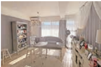
洗練されたラグジュアリーな空間と感動のおもてなしは、心も癒されリフレッシュできる

良い香りに包まれモリンガやチャーガなど選べる黄土蒸しで温活しながら毛穴やシメケアもできると好評。レーザーとは違う「低周波シメケア」は肌に優しく根本から改善できるという声も多い。平塚では数少ない「毛穴エクストラクション(毛穴洗浄)」導入サロンでもあり、マシンやクリニックでも結果が出ない毛穴の黒ずみもスッキリ。キレイを実感したい人はお早めにご予約を!