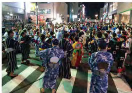
みんなで郡上おどりを体感!

盆踊りのルーツではないかといわれている踊り念仏。そのゆかりの寺が藤沢にある時宗総本山遊行寺です。藤沢=盆踊りのまちをテーマに17年前、誕生したイベントが「藤沢宿・遊行の盆」。創作踊りの遊行ばやしコンテストや遊行寺でやぐらを囲み、市民が盆踊りに興じます。招致された日本三大盆踊り(西馬音内盆踊り、阿波踊り、郡上おどり)にも毎年固定ファンが多く集います。