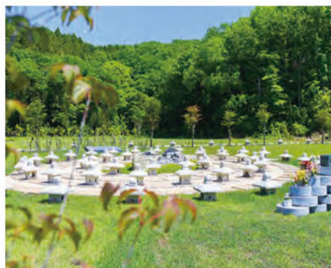
墓地承継者のいない人でも合葬として納骨できる永代供養墓の「かがり野」。墓誌に名前の彫刻も可能だ(有料)