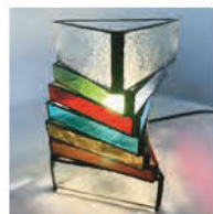
個性的なフォルムのステンドグラスランプ

ステンドグラス体験会 先着8人限定 要予約 開催 水・木・金・土 日時 10:00~16:00 上記で都合のよい時間(3時間程度) ※予約、問い合わせは電話で。体験会は少人数制で実施しています