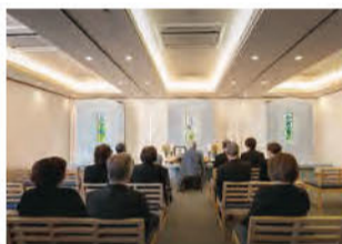
最大55名まで利用可能な礼拝室。宗教不問。法要に応じて僧侶・神官の手配もしてくれる