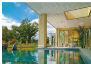
管理棟のエントランス。管理棟には受付をはじめ、礼拝室や会席所など機能的かつ洗練された設備が整う