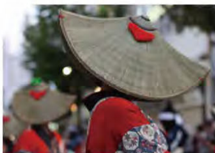
優美な手先にうっとり……西馬音内盆踊り