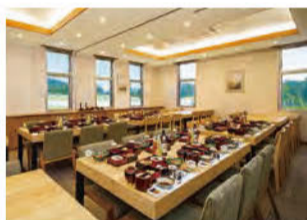
窓越しに園内を眺めながら故人を偲ぶことができる会席所。最大48名まで。料理の手配もしてくれる

「その木陰で休むことはないと知りながら老人が植えた苗木(種)は、やがて素晴らしい樹木(社会)に成長する」(古代ギリシャのことわざ)。 湘南森林霊園は、まさにこのことわざを実践している霊園だ。スウェーデンにある「スコグスシユルコゴードン(森の墓地)」をヒントに、太古の森に生息している樹木種のみを植林。10年、30年かけて森と同化していく姿をイメージしながら死者の