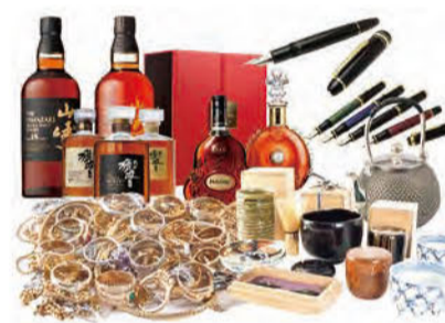
棚の奥で眠っているブランデーなどがあれば相談を

お酒のほかにも買い取り品目は豊富で、金・プラチナ、ダイヤモンド、ブランドバッグ・時計、骨董品、茶道具、掛け軸、万年筆などの取り扱いも。査定・出張費無料で出張現金買い取りも対応してくれるので、まずは相談を。