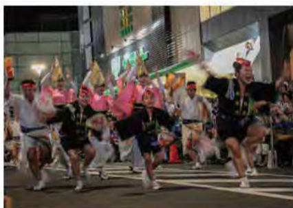
高円寺朱雀連による阿波おどりに活気をもらって