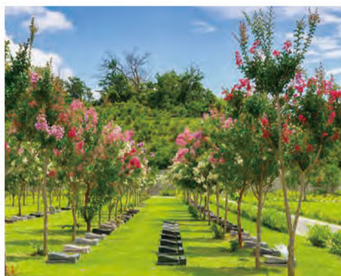
湘南森林霊園の代名詞ともいえる花木墓所。春にはスイセンやヤマブキ、夏にはサルズベリ、秋には彼岸花が咲き誇る