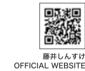
藤井しんすけ OFFICIAL WEBSITE

神奈川県議員 Profile 兵庫県神戸市出身、1957年4月19日生まれ。創価大学経営学部を卒業し、製薬会社での勤務を経て、1999年に横浜市神奈川区で神奈川県議会議員初当選。2023年4月に平塚市で7期目の当選。「政治とは人民の幸福のために力を尽くすことである」をモットーに活動している。神奈川県議会建設企業常任委員会委員、神奈川県国土利用計画審議会委員。