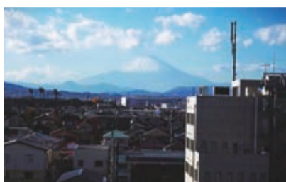
天気の良い日に腰高花壇のある屋上から見える富士山