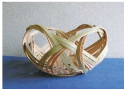
講習会作品(四海波籠)

創立から36年を迎える竹遊会主催の竹芸展が6月6日(木)～11日(火)にひらつか市民プラザで開催。「竹芸技術習得とその向上」、「竹の文化の普及とボランティア活動」をテーマに精力的に活動している同会。会期中は49人の会員らが制作した作品約90点が展示されるほか8日(土)、9日(日)には来場者を対象とした竹芸講習会が催される。午前と午後の部で子どもと大人を対象に「四海波籠」作りが体験できる。期間中は各種竹作品の販売も行なわれ、子どもから大人まで幅広く楽しめる内容となっている。