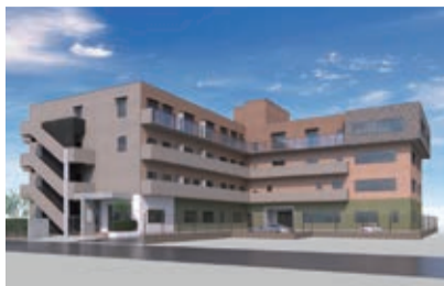
建物の外観イメージ